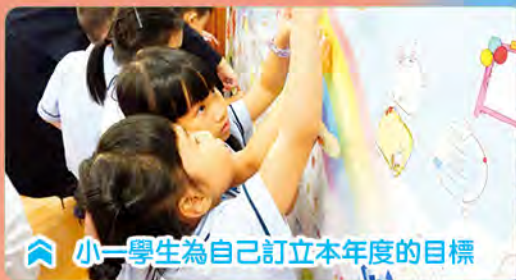
小一學生為自己訂立本年度的目標