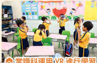
常識科運用 VR 進行學習