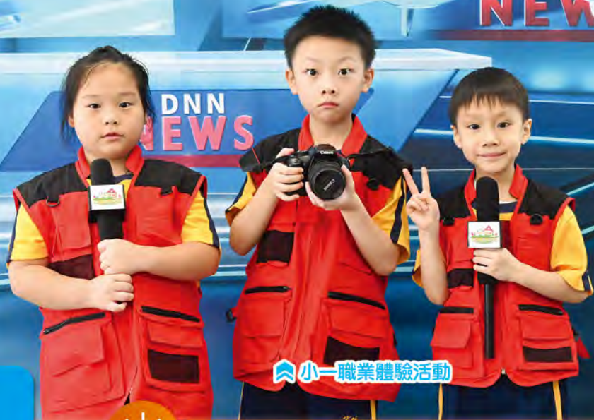
小一職業體驗活動