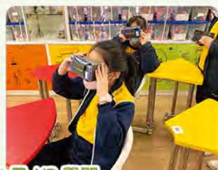
學生使用 Padlet 及 VR 學習