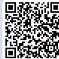
教育局視學報告： 幼小銜接