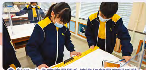
以 Kiosk 全方位學習系統進行數學遊蹤活動。

數學科除了善用出版社提供的「現代出版社電子學習平台」外，更在全校 iPad 下載出版社提供的「e+數學探究 App」，利用工具製作立體圖形，從而找出各立體圖形的頂、稜、面的數量和進行探究；此外，教師也會搜羅其他適切的數學科電子學習工具，如利用 Geogebra 於課堂中協助進行建構數學概念或數學探究活動，同時也可讓學生在家中作自學之用；學校更以 Kiosk 全方位學習系統，讓四至六年級於數學日進行校內電子數學遊蹤活動。