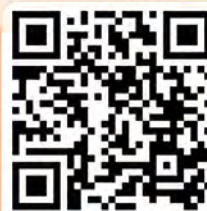
愉快的小一 學習生活

擁有優良校風的學校能培養學生良好品德，關愛身邊人。他們能夠在學校愉快學習，塑造正確的價值觀，並對學校產生歸屬感。因此，除了學業成績外，家長為子女選擇學校時，亦應把德育範疇加入考量之中。