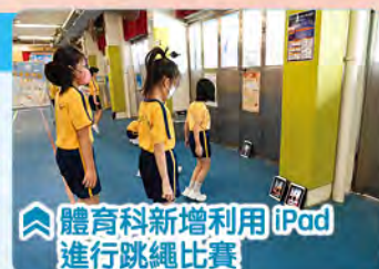
體育科新增利用 iPad 進行跳繩比賽

體育科使用 EDX Kiosk 電子學習活動站，於日常課堂中進行電子跳繩教學，提升學生對跳繩的興趣。另外亦使用 iPad 跳繩 APP，讓學生在體育課堂中跟其他班別同學進行班際比賽，培養他們的團體精神。