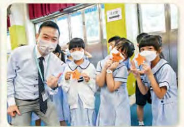
▲「擁抱夢想 閃耀飛翔」目標訂立活動