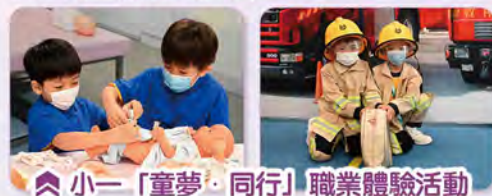
▲小一「童夢·同行」職業體驗活動