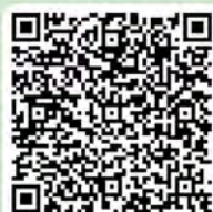
21-22 年度 升中派位結果