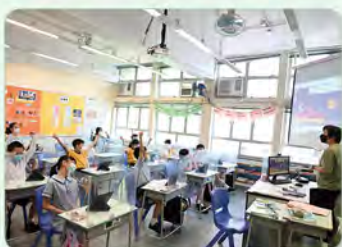
英文科透過 Kahoot 鞏固課堂知識

日常課堂方面，老師和學生已熟習運用 iPad 上課，他們能透過 Padlet 及 Kahoot 等應用程式鞏固課堂知識，也可以分組在互聯網搜集資料。