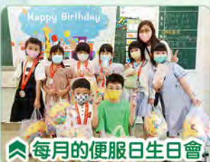
每月的便服生日會

學校亦致力透過訓輔計劃提升學生感恩、關愛等正向元素，讓學生切身感受被關愛的溫暖。學校會每月特定一天慶祝生日，生日月內的學生可在當天穿著便服回校。班主任會為他們悉心舉辦生日會，送上生日卡，並掛上生日襟章，接受大家祝福。活動現時已推廣至教職員層面，除定期為他們舉辦生日會及「心靈加油站」外，生日教職員更可揀選一天提早一小時下班，希望藉此讓老師感受到關愛。而配合學校六十周年校慶，學校亦送贈了全校師生一件「校慶運動衣」，讓師生於各項校慶活動中穿著，以營造彩虹七色的環境，提升團隊的凝聚力。