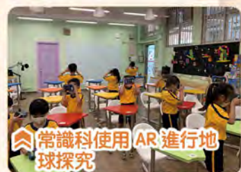
常識科使用 AR 進行地球探究