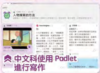
中文科使用 Padlet 進行寫作