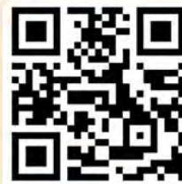
愉快的小一 學習生活

校園內的老師教學有趣、多與學生互動，自然能提升學生的學習興趣。事實上，不少研究顯示，讓孩子在輕鬆愉快的氛圍下學習，學習的效率和結果都大大高於嚴肅的氛圍。