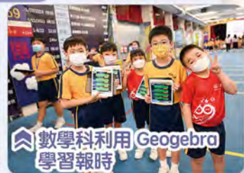
數學科利用 Geogebra 學習報時