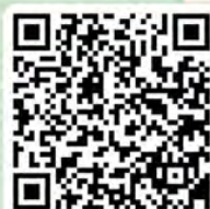
教育局視學報告： 幼小銜接