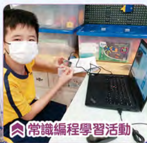
常識編程學習活動