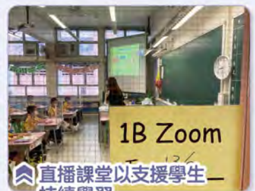
直播課堂以支援學生持續學習

疫情期間，學校除了向學生提供快速檢測包、安排自攜午膳服務及接種新冠疫苗外，學校亦著意為受疫情影響而需要隔離的學生安排網上實時直播課堂，支援學生持續學習。學校亦關心學生的健康，特意成立體重管理小組，提高家長對子女體格狀況的關注，跟進體重超標的學生，亦鼓勵老師於課堂中安排全班學生做簡單的伸展動作。本校更獲香港電台邀請協助拍攝鏗鏘集節目《孩子胖了》，以關注及改善學生的體重。