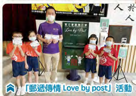
「郵遞傳情 Love by post」活動

學。今天，我寫這封信給你是想和你聊聊一件事——學生壓力。我個人認為，小朋友的壓力不是學習，而是家長對自己孩子成績的期望。同時，因為大眾效應，很多家長都認為，越高排名的學校會令自己的成績更好，這就造成有一些學生因為不適合就讀該學校而造成自身的壓力十分大。我希望劉校長可以告訴家長們，成績不是一切，家長應該找一間適合自己孩子的學校。謝謝。