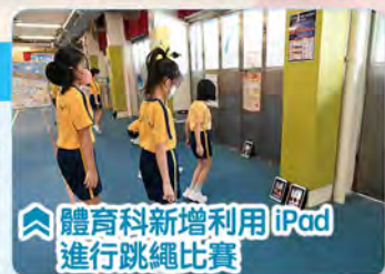
體育科新增利用 iPad 進行跳繩比賽

體育科使用 EDX Kiosk 電子學習活動站，於日常課堂中進行電子跳繩教學，提升學生對跳繩的趣味。另外今年也新增使用 iPad 跳繩 APP，讓學生在體育課堂中跟其他班別同學進行班制比賽，訓練他們的團體精神。