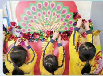
學生製作「花牌」 傳承中國傳統文化