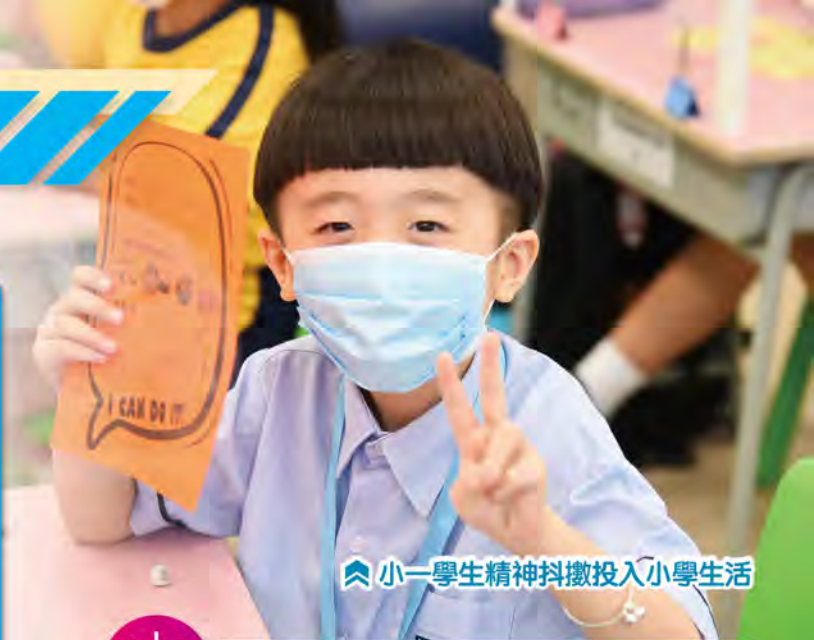
小一學生精神抖擻投入小學生活

不少家長會為孩子製作個人檔案 (Portfolio)，以記錄孩子的學習歷程，供學校校長及老師參閱。個人檔案內容可包括家庭成員的基本資料及孩子的突出表現，頁數不宜太多，建議 4 至 5 頁紙為佳；又或以錄像方式展示，內容亦可以放大，令人容易閱讀。由於學校每年接收不少學生的個人檔案，因此家長可稍作簡潔設計，以帶出鶴立雞群的效果。