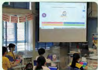
學生透過 Kahoot 等應用程式鞏固課堂知識

日常課堂方面，老師和學生已熟習運用 iPad 上課，他們能透過 Kahoot 等應用程式鞏固課堂知識，也可以分組在互聯網搜集資料。