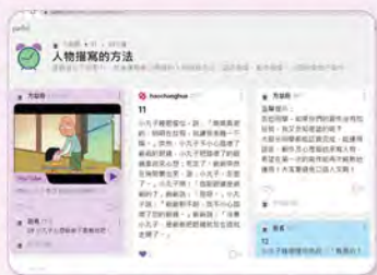
學生利用 padlet 的影片進行寫作

電子教材方面，本年度三及五年級會利用虛擬實境 (VR) 進行寫作活動，打破傳統教學局限，利用電腦模擬產生一個三維空間的虛擬世界，讓學生彷彿身歷其境後，再運用步移法寫作。此外，為增強師生互動，在課堂上會利用 padlet、kahoot 等軟件，以有趣、互動的方式檢視學生的學習進度及作出即時的回饋。